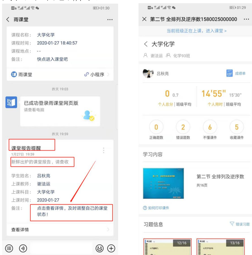
图 14 课堂报告

每次直播结束后每位同学都会收到雨课堂自动推送给大家的学习报告。错误习题、不懂课件、收藏课件、课程 PPT，雨课堂都帮各位同学整理好，关注每一节课的动态，助力你的改变和成长，如图 14 所示。