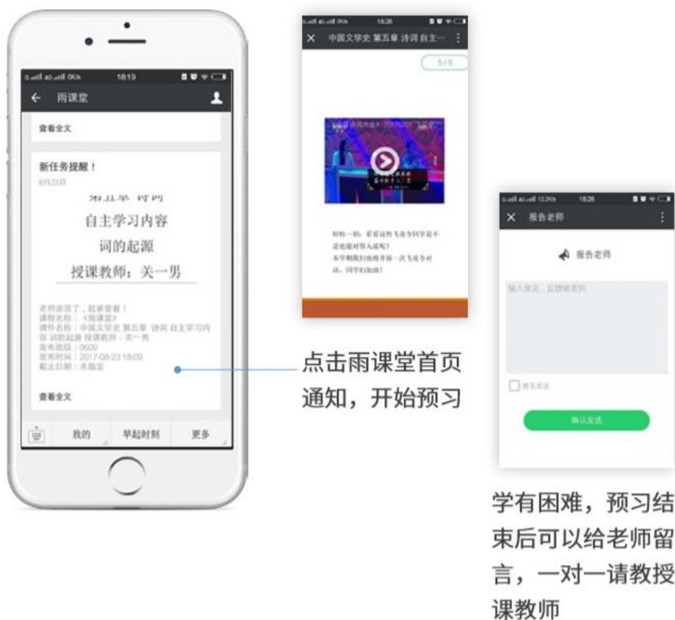
图 15 接收预习任务并完成预习

若老师给学生推送了预习资料，各位同学将在雨课堂公众号里收到相应的通知提醒，点击该提醒即可启动预习，预习之后带着思考去上课。（ 温馨提示：请在老师规定时间内完成预习。老师能看到你什么时候完成预习，预习了哪几页等信息 ）