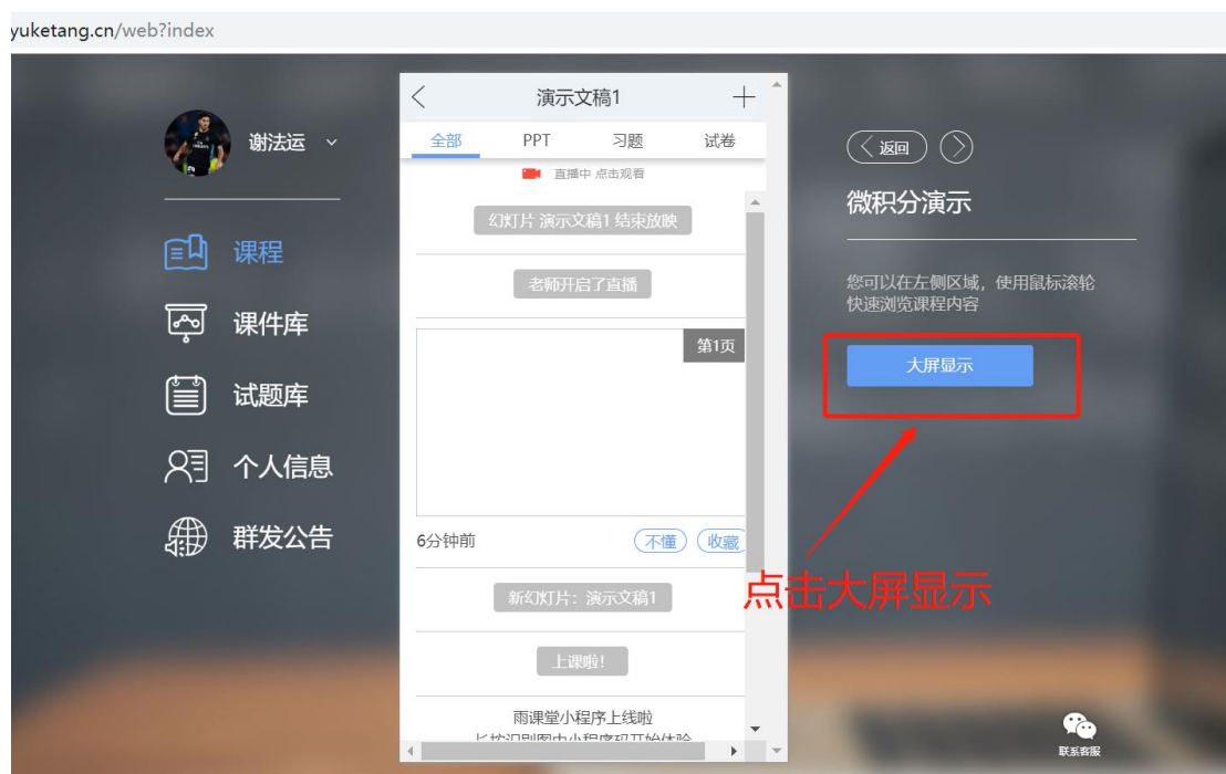
图 9 可进入大屏显示