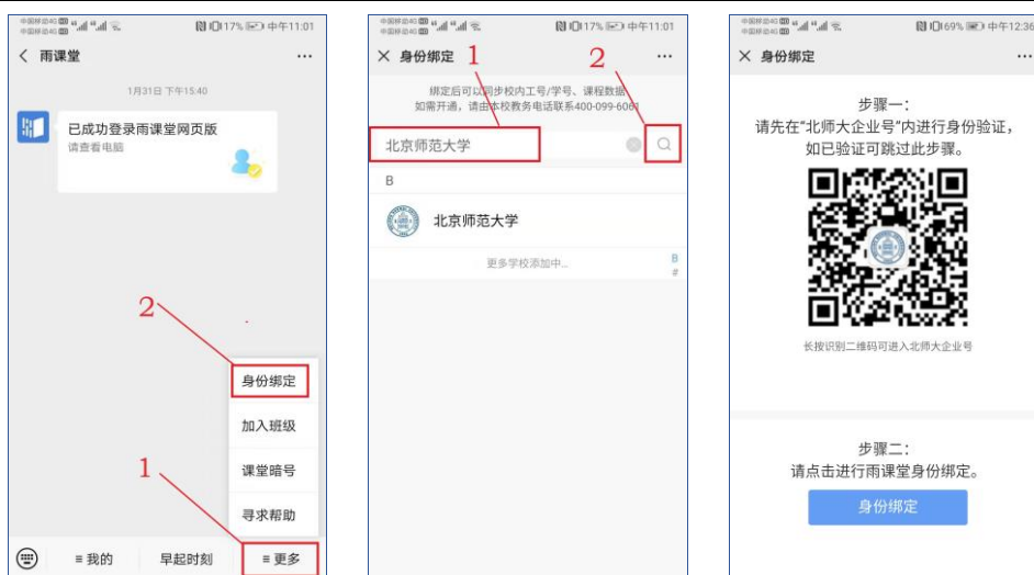
图 2 身份绑定