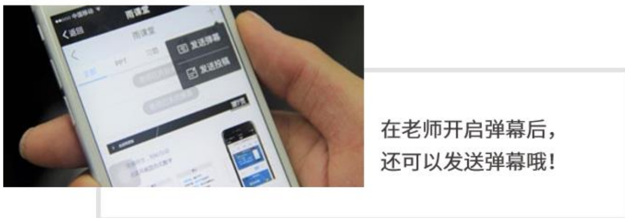
图 13 弹幕投稿操作

点击手机屏幕右上角的【+】，选择【发送投稿】，就可以随时发送图文消息给老师，如图 13 所示。