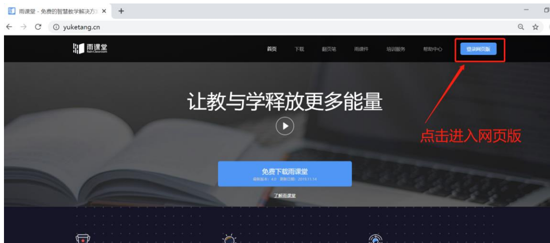
图 7 雨课堂网页版登录界面

通过浏览器进入雨课堂网页版（ http://yuketang.cn ），点击右上角【登录网页版】，如图 7 所示。之后用绑定了账号的微信扫码进入课程观看页面。