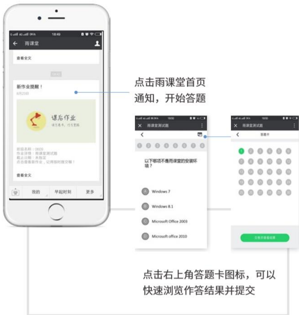
图 16 作业提醒