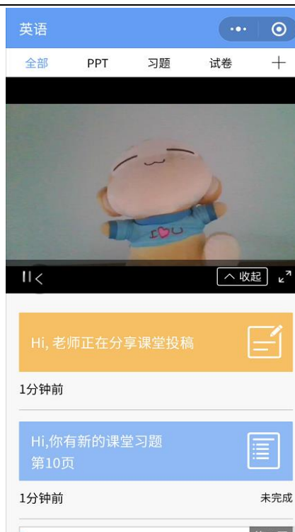
图 9 学生手机端直播预览效果