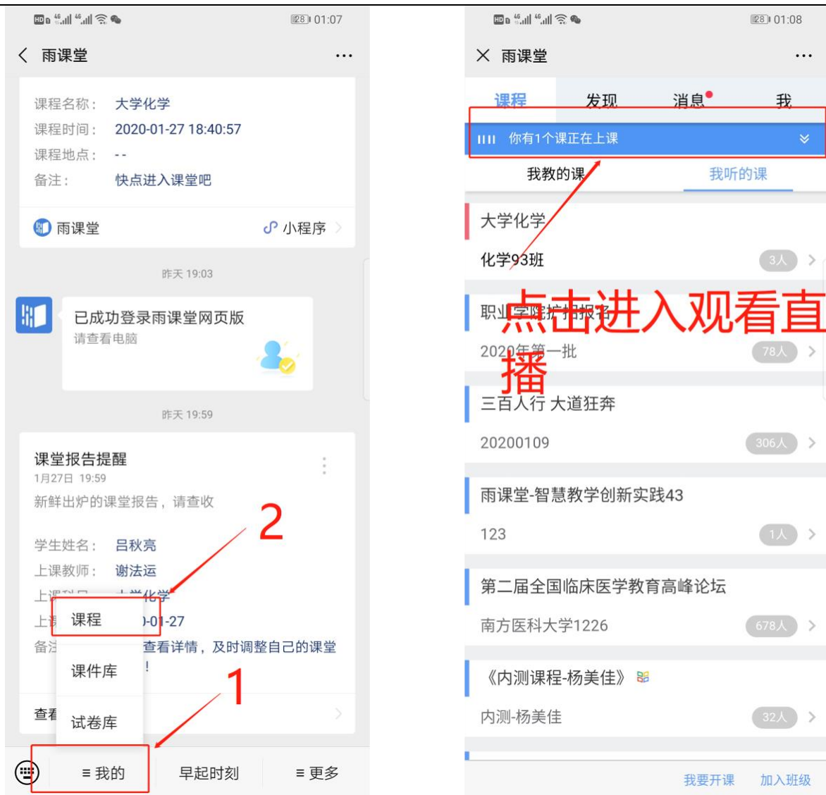
图 6 公众号进入直播