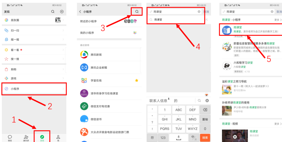
图 4 搜索进入雨课堂小程序

进入雨课堂小程序后，在小程序上方若发现有“你有 1 个课正在上课”的提示，点击该提示即可进入直播。如图 5 所示。