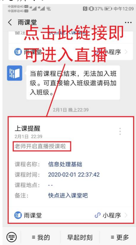
图 3 学生接收上课直播提醒

(1) 教师可在开启直播时给学生发送通知，学生可在微信公众号里收到直播提醒，点击此消息即可进入直播。如图 3 所示。