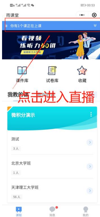
图 5 小程序进入直播界面

进入雨课堂小程序后，在小程序上方若发现有“你有 1 个课正在上课”的提示，点击该提示即可进入直播。如图 5 所示。